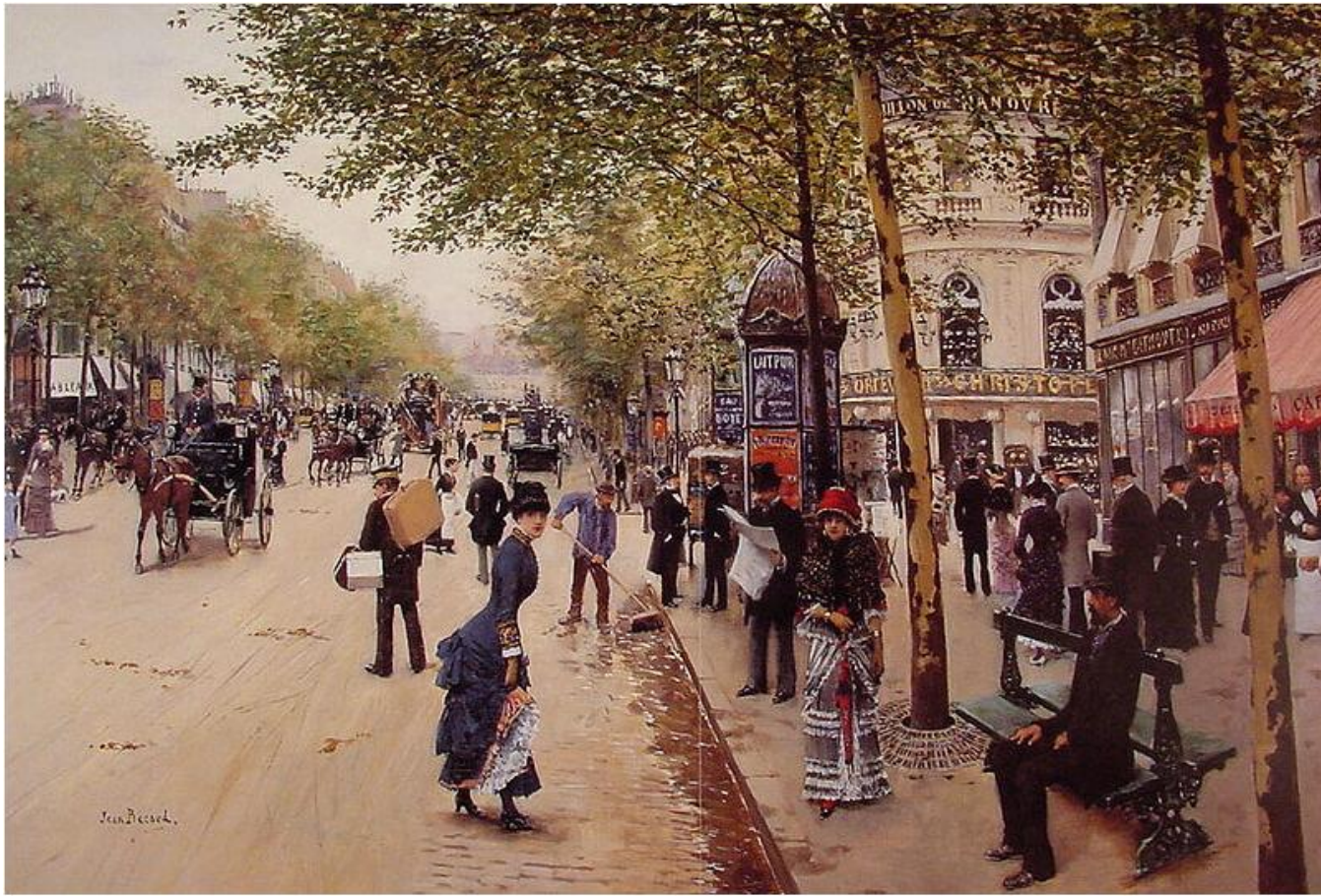
Jean Béraud, Boulevard des Capucines , Collection privée