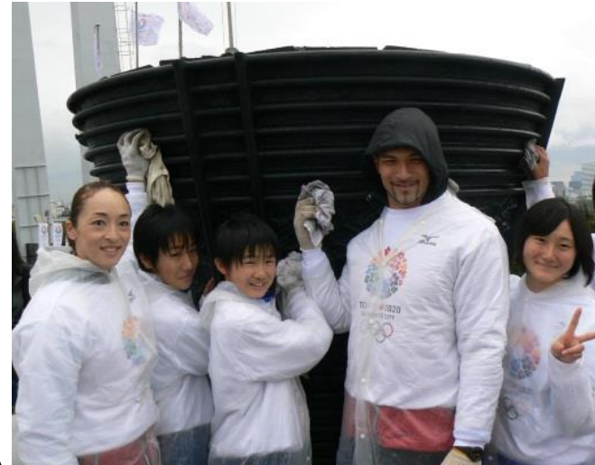
聖火台磨きイベント