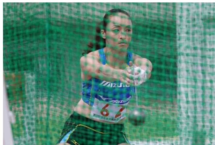
ハンマー投 日本記録 67m77(2004年)