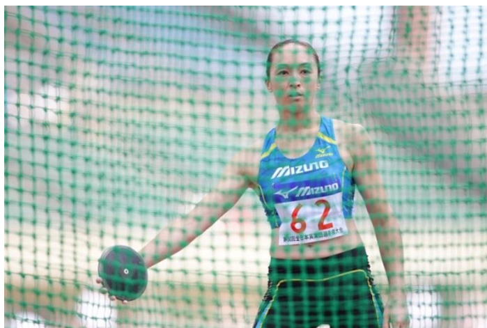
円盤投 日本記録 58m62(2007年)