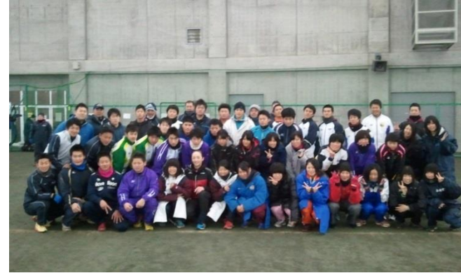
東北高体連合宿講師・講演会